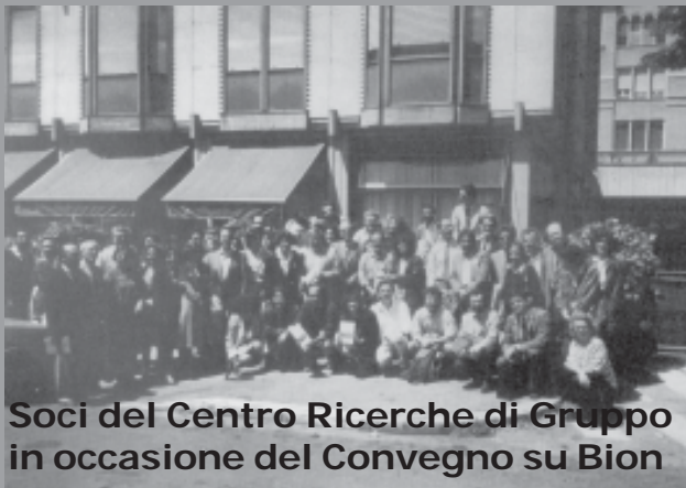
Soci del Centro Ricerche di Gruppo in occasione del Convegno su Bion

Correale: Il terreno è opinabile e sottoposto a numerosissime differenze di valutazione. Classicamente si ritiene più indicato per il gruppo il paziente con più tendenza all' acting , più in difficoltà di fronte all'integrazione di parti scisse molto intense e in genere chiunque tende a vivere nell'incontro individuale vissuti troppo oppressivi di claustrofobia e persecutorietà. Sulla scorta di Bion e dei suoi seguaci, inoltre, il gruppo si è mostrato particolarmente utile nel fronteggiamento di aspetti psicotici della