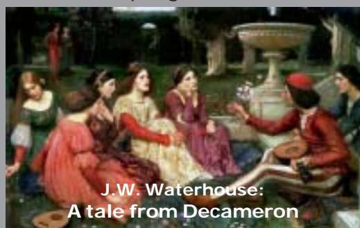
J.W. Waterhouse: A tale from Decameron

Un gruppo di ragazze e ragazzi si riuniscono, sulle colline intorno a Firenze, per affrontare ed elaborare la peste attraverso un'attività ricreativa, ludica; attraverso il narrare storie e novelle, che si riferiscono prevalentemente alla sessualità. Vi è dunque un contesto più generale, la città, uno più piccolo, il gruppo di ragazzi e ragazze, infine i racconti dei ragazzi.